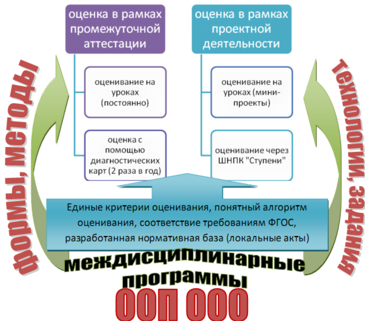
Рис. 1. Схема оценки метапредметных планируемых результатов обучающихся ООО

Оценка достижения метапредметных результатов осуществляется администрацией образовательной организации в ходе внутришкольного мониторинга . Содержание и периодичность внутришкольного мониторинга устанавливается решением педагогического совета. Инструментарий строится на межпредметной основе и может включать диагностические материалы по оценке читательской грамотности, ИКТ-компетентности, сформированности регулятивных, коммуникативных и познавательных учебных действий.